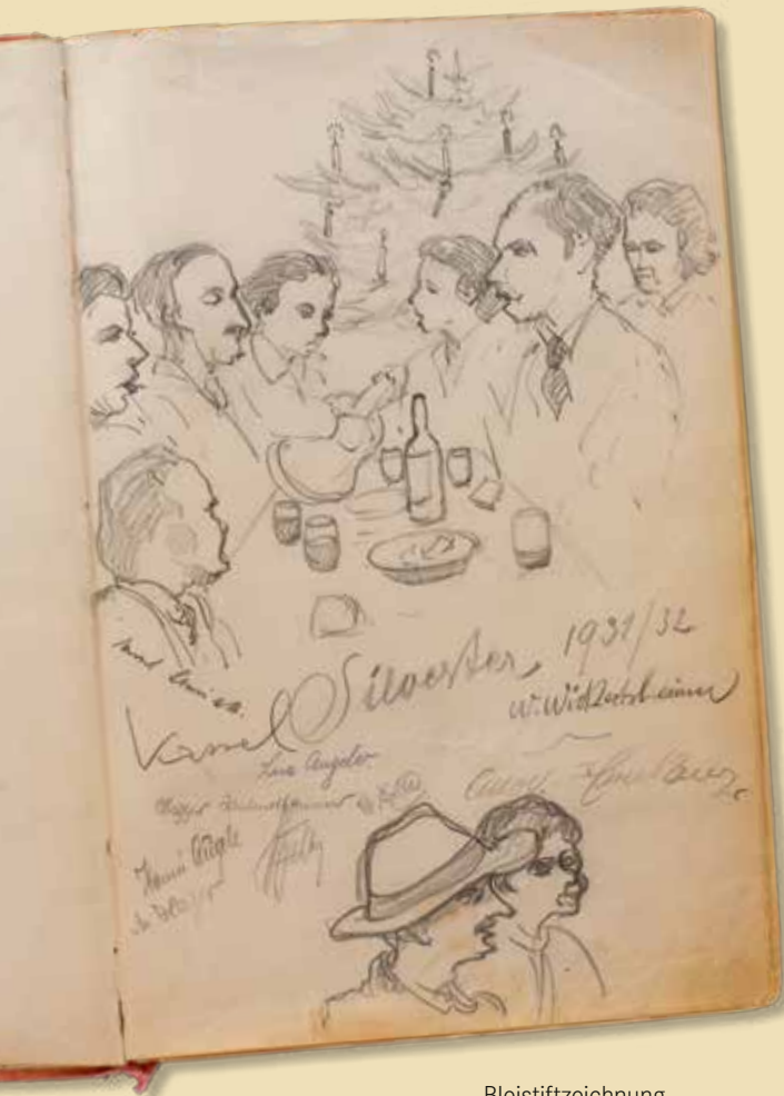
Bleistiftzeichnung von Wilhelm Wickertsheimer Silvester 1931/32