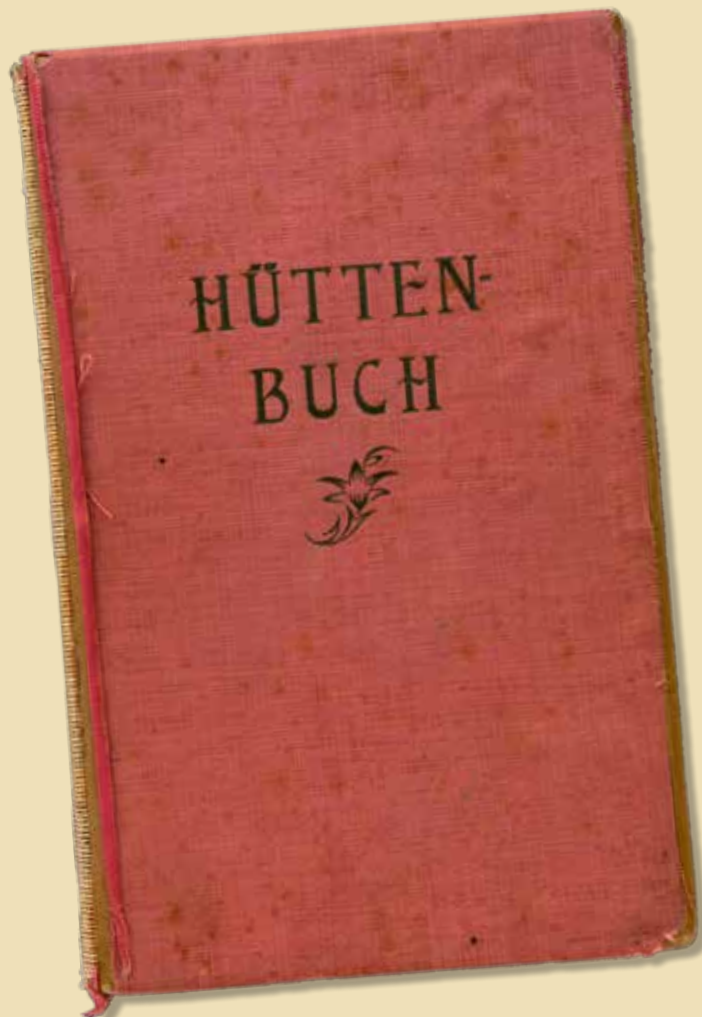
Das erste Hüttenbuch von 1931