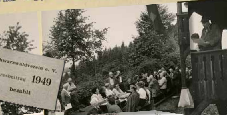
La hrer Hütte am Geisberg 700 m Post Schweighausen

Schwarzwaldverein e. V. Jahresbeitrag 1949 bezahlt